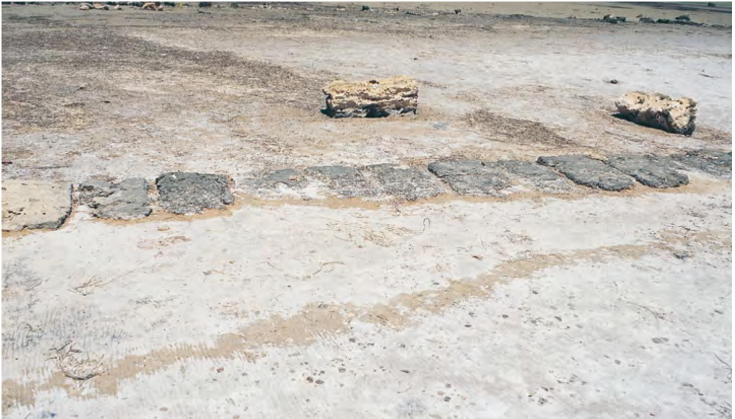
Fig. 3 : Le port, détail