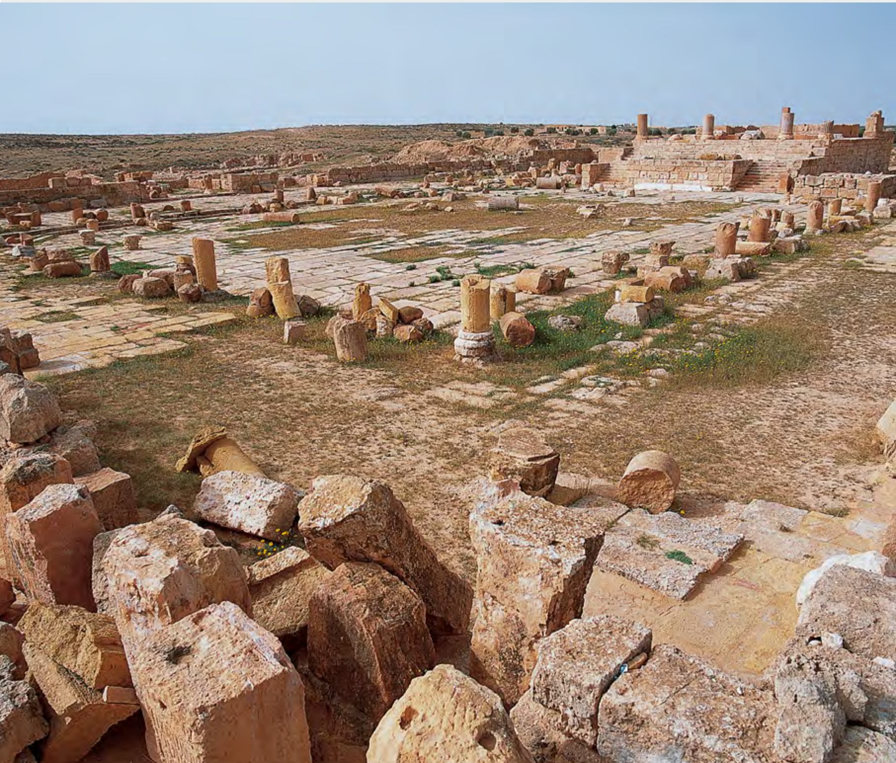
Fig. 1 : Le forum