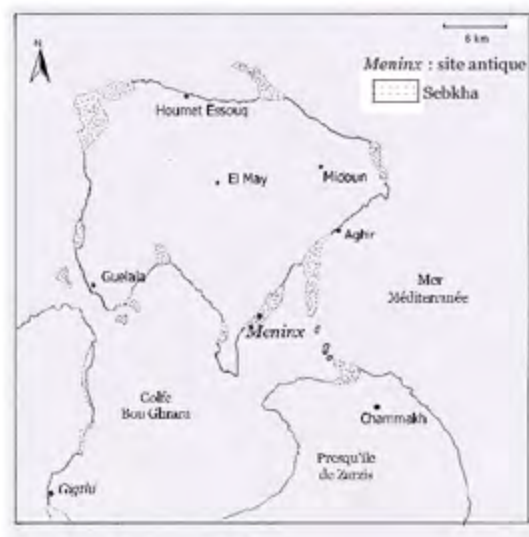
Fig 1 : plan de Djerba

Le noyau urbain de la ville préromaine n'est pas connu, mais il devrait s'étendre à proximité du port évoqué par le Stadiasme , ( SMM, 105 ). Selon ce portulan la cité de