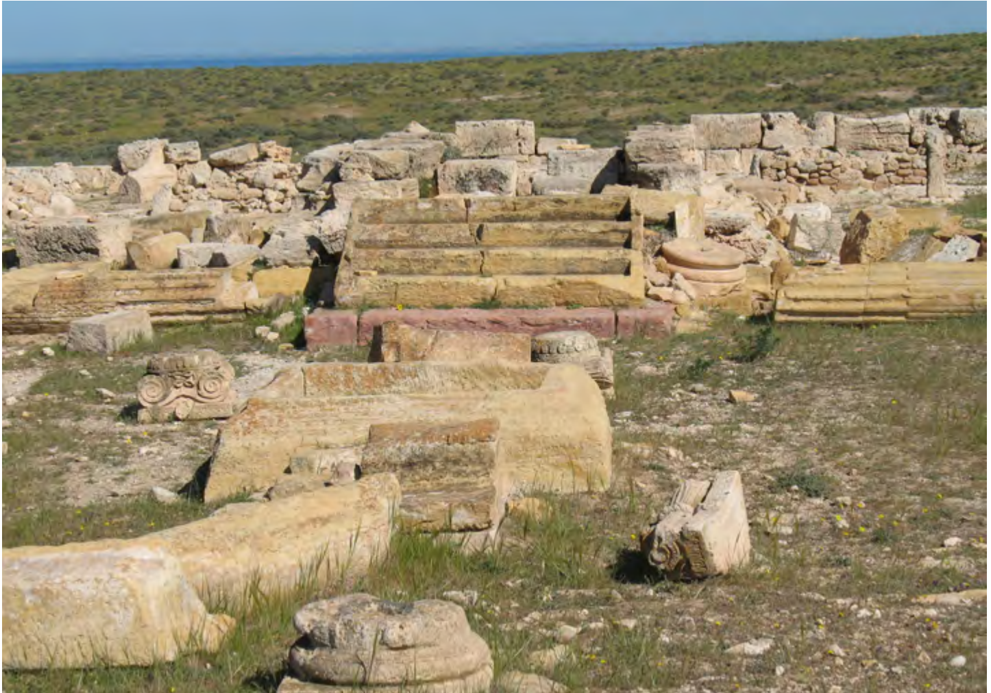
Fig. 2 : Le temple de Mercure