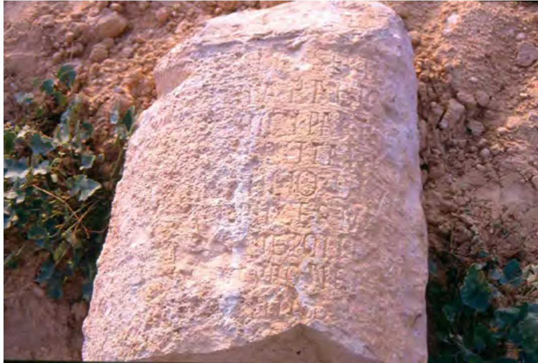
Fig. 6 : borne milliaire implantée sur la voie reliant Gigthi à Tacape

Au sud-ouest du forum, s'élève un temple destiné au Génie d'Auguste, et au nord se dresse un monument consacré probablement à la Curie (n° 3). Sur le portique Nord s'ouvrent des lieux de culte: le sanctuaire d'Hercule, le temple de la déesse Concorde, le temple d'Apollon, puis deux temples indéterminés (n° 4) à proximité desquels est construit l' aerarium . Le portique Est s'ouvre au nord sur le temple de Liber Pater (n° 5) puis sur la Basilique (salle de justice) (n° 6). La voie qui part de la porte Est du Forum se dirige vers le Grand Temple (n° 7) et un édifice doté d'une cour entourée de tous les côtés d'un Portique (n° 9). A proximité s'élève un petit temple consacré à Esculape (n° 8). Quant à la porte sud elle nous permet d'accéder aux insulae (n° 11), puis aux thermes du centre (n° 12).