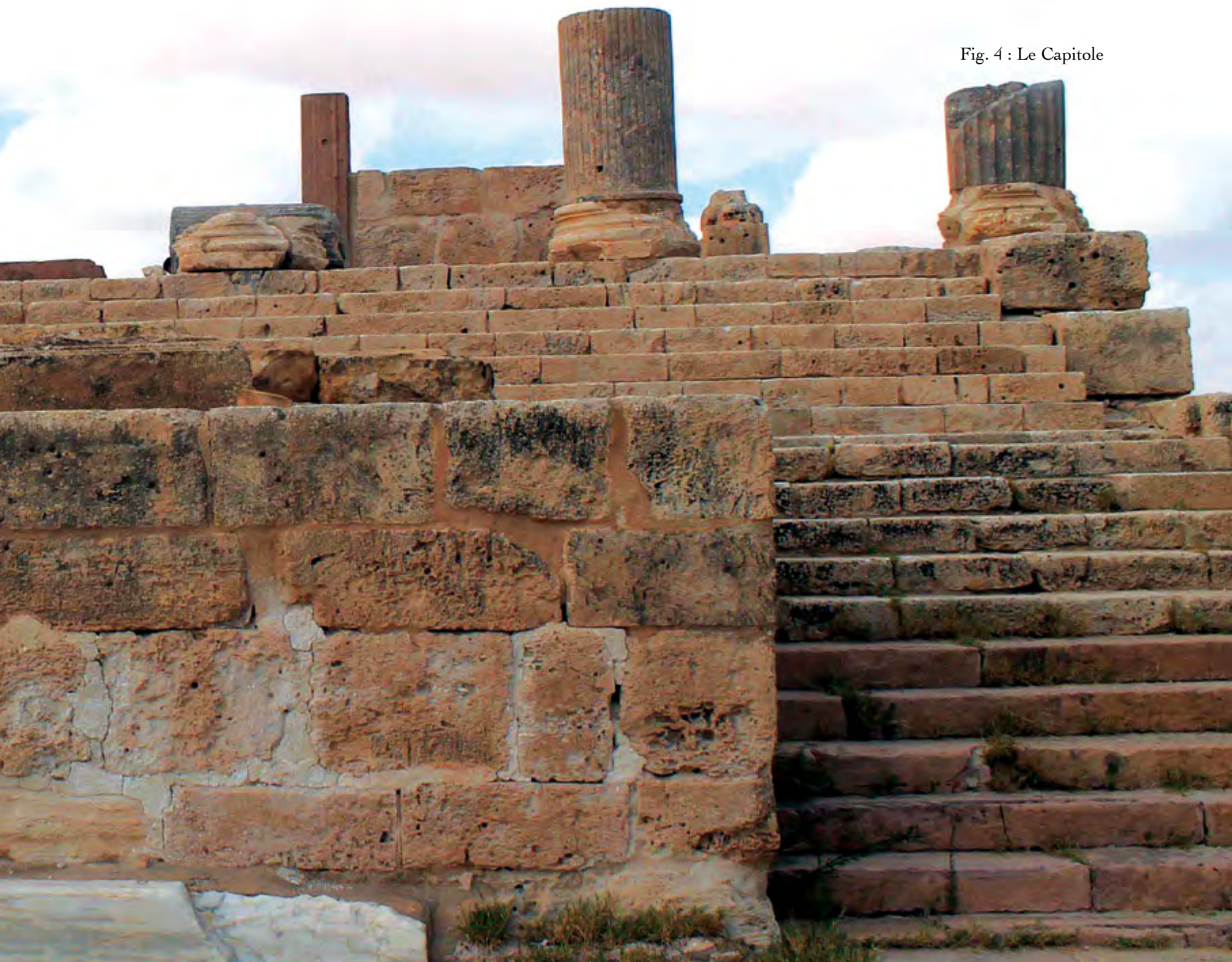
Fig. 4 : Le Capitole

Après avoir obtenu le statut de municipes qui lui a été accordé par l'empereur Antonin le Pieux (138-161) qualifié sur une inscription de conditor municipii , Gigthi se dota d'un ordo decurionum chargé de la gestion quotidienne des Gigthenses. Tous les témoignages réunis jusqu'ici concordent pour situer la période de son développement urbain et de son apogée aux II e et début du III e s. Ceci correspond au phénomène général de la floraison des villes qui a caractérisé, sous l'empire romain, le territoire de l'actuelle Tunisie.