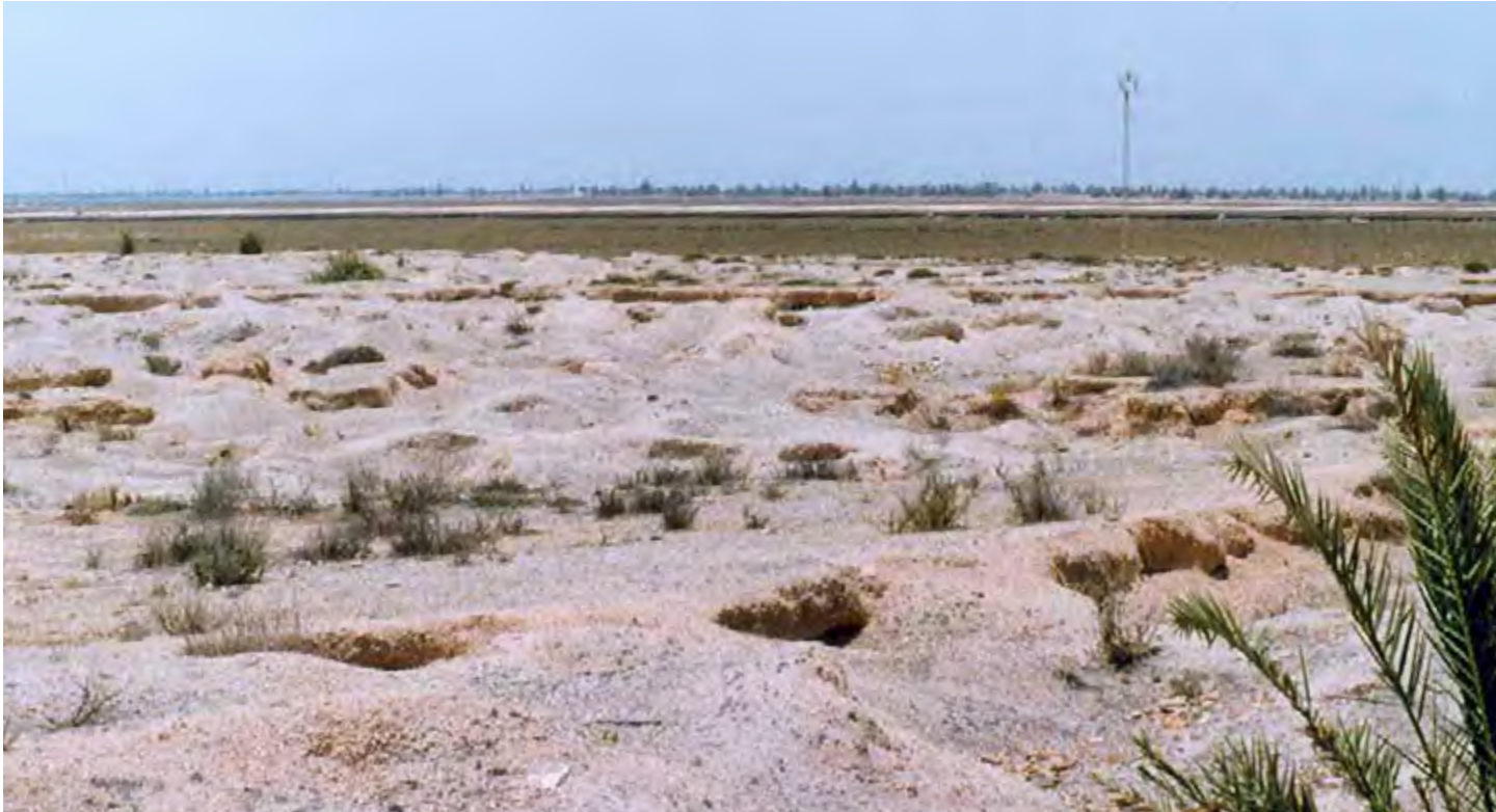
Fig 2 : Dunes de Murex pilés s'étendant à l'ouest du site

miques les datent des III e et II e siècles av.J.-C. Ces monuments permettent d'évaluer en gros la surface sur laquelle s'étendait la ville punique, ce qui confirme les témoignages du Stadiasmé à propos de l'importance de cette ville qui a rayonné dans l'île.